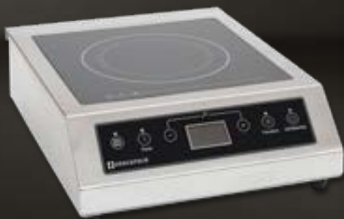
RS615 Piastra a induzione digitale 3500W