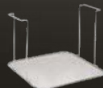
RS647 Filtro residui per fritti in acciaio inox AISI 304 elettro-lucidato mm 320 x 320 x 240 (H)