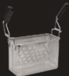
RS641 Cestello cuocipasta 1/2 in acciaio inox AISI 304. mm 308 x 150 x 200 (H)