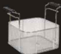
RS649 Cestello per fritti 1/1 materiale certificato S235JR cromato secondo normativa UNI EN ISO 1456:2009 Fe/ Ni10b/Crr. mm 295 x 300 x 150 (H)