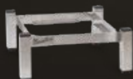
RS644 Marcellino Mobile in acciaio inox AISI 304 mm 420 x 420 x 18 (H)