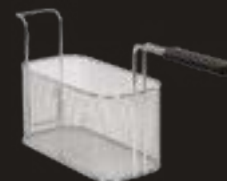
RS650 Cestello per fritti 1/2 mm materiale certificato S235JR cromato secondo normativa UNI EN ISO 1456:2009 Fe/ Ni10b/Crr. mm 290 x 145 x 150 (H)